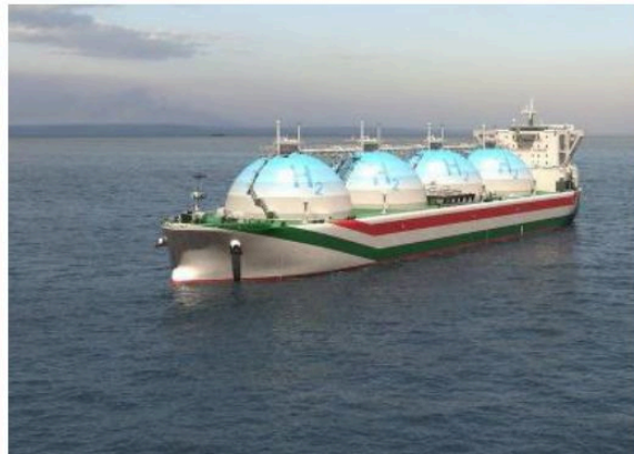
La nave per il trasporto dell'idrogeno

«Agnes può essere costruito in tre anni perché non necessita di alcuna modifica al Porto di Ravenna o di una nuova connessione alla rete. Il nostro auspicio è che il governo comprenda, l'importanza strategica nazionale di questo progetto e decida di bandire le aste per eolico e fotovoltaico offshore al più presto con un semplice adeguamento della tariffa».