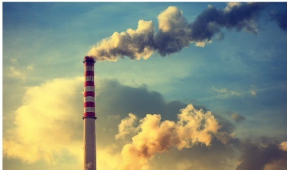
Emissioni di anidride carbonica