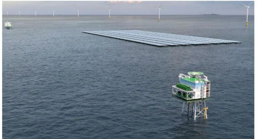
Parco e pale eoliche in due punti del mare Adriatico a oltre 12 miglia dalla costa: ecco cosa prevede il progetto Agnes

«Cercando di convincere il Governo ad andare avanti con le aste, ma dall'altra parte condividiamo le richieste di un aumento della tariffa di partenza che è bas-