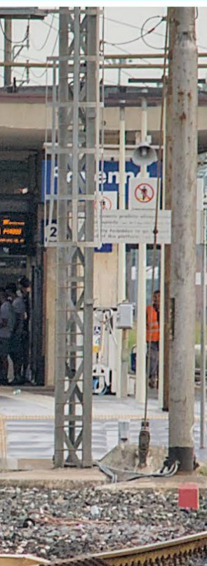
Il treno regionale Rimini Bologna 4000, fermo in stazione a Ravenna per l'intervento della polizia a bordo

Per il sindacato, servono interventi strutturali. «Stiamo andando verso una società in cui il valore delle persone viene riconosciuto sempre meno. E invece è evidente che la sorveglianza funziona meglio quando c'è più personale: vigilanza privata, pattuglie, guardie giurate. Non si deve arrivare al punto in cui chi controlla rimane completamente isolato. Occorre investire sul personale, aumentarlo, renderlo parte di un sistema di sicurezza diffuso e coordinato». V.B.