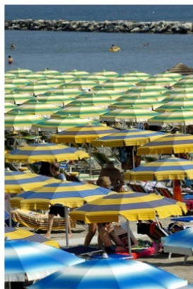
Ombrelloni sulla spiaggia

soni, «così come va nella direzione giusta - aggiunge - la decisione di concentrare l'attenzione su due temi centrali: la riqualificazione dell'offerta ricettiva e l'attuazione della direttiva Bolkestein». In più occasioni Legacoop ha avanzato la richiesta di convocare gli Stati generali del turismo, così come fatto anche dalle Uil territoriali di Ravenna, Forlì, Cesena e Rimini: «Oggi, con la prospettiva di un percorso strutturato e condiviso, riteniamo che ci siano le condizioni per aprire davvero questa fase nuova. Basta con le polemiche che non fanno bene al turismo, è il momento di la-