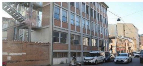
La scuola media Damiano vista da via di Roma

«La volontà dell'Amministrazione comunale - prosegue il Comune - è quella di mantenere la capilla-